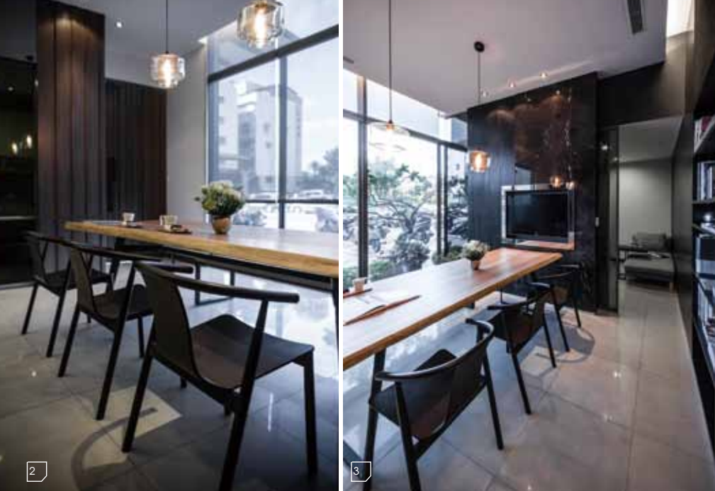
2.3.4. 挑高的多功能會議室，職員能在此討論提案或是用餐。 5. 空間中的主要建材，以深色的天然物料為主，也具備展示的作用，在空間中和諧地共存。

時採用親切的木質傢俱，將空間襯托得更溫暖，再加上落地窗外有大片的陽光和綠地，不僅在視覺上化解室內小坪數的侷限，也讓這裡有如咖啡館的角落，成功地翻轉辦公室所給予人的刻板印象。