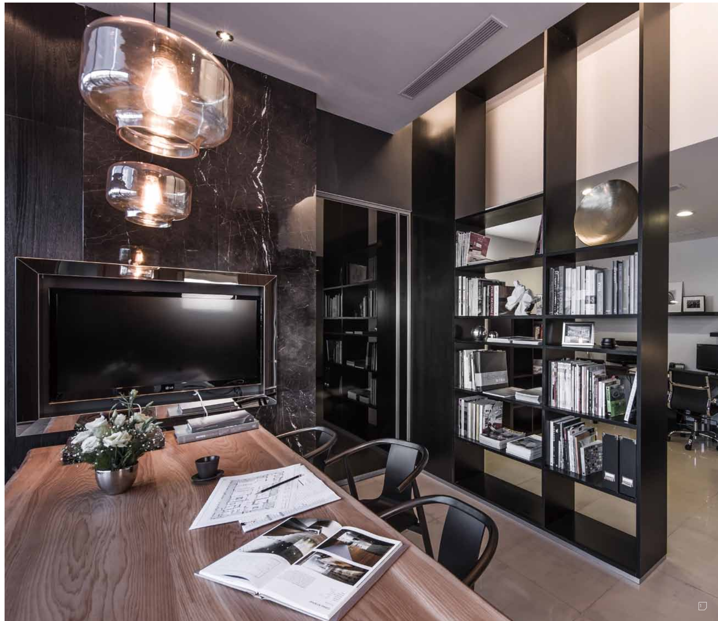
1 著重在營造氛圍的辦公空間。

從玄關進來，是一處挑高的多功能大廳，這裡也是空間軸線的核心，職員們可以齊聚一堂討論提案或是用餐。天花懸掛著復古優雅的玻璃罩吊燈，利用朦朧的黃光來照明，同